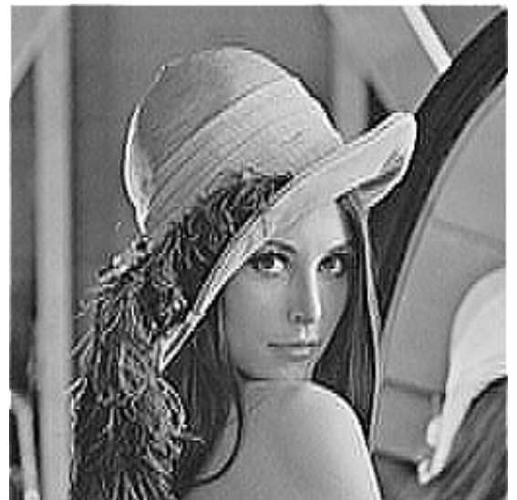
Con filtro de acentuado