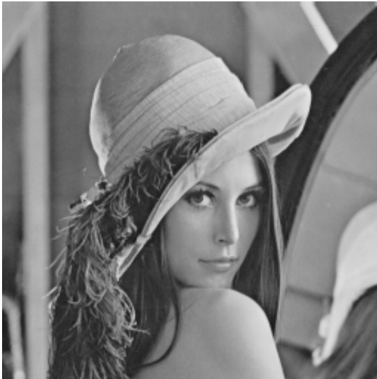
Tamaño archivo 43Kb

En las siguientes imágenes se observa una imagen original y la imagen comprimida utilizando el método de compresión JPEG tradicional.