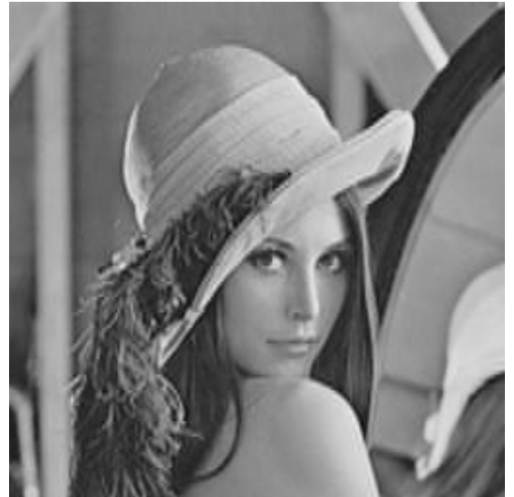
Tamaño archivo 9Kb

A continuación se muestra el resultado de aplicar el método propuesto a la imagen anterior: