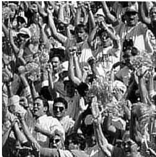
Comprimida Enfatizada 19Kb

La calidad obtenida disminuye a medida que aumenta el nivel de detalle de la imagen.