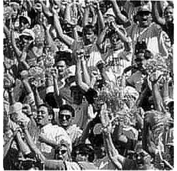
Con filtro de acentuado