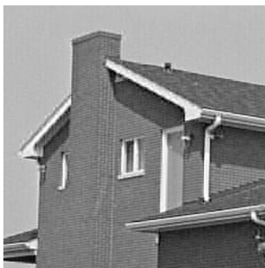
Comprimida Enfatizada 11Kb

Se obtiene una imagen de mejor calidad visual en comparación con el método estándar.