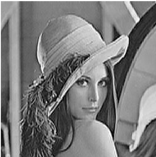
Con acentuado JPEG