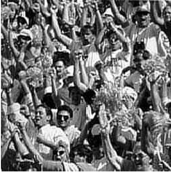
Con acentuado JPEG