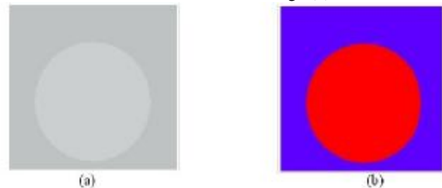
Figura 1: Formas geométricas simples

Para obtener los resultados de este trabajo utilizamos dos imágenes, con diferente complejidad, la primera es una figura simple, con dos figuras geométricas bien definidas, las cuales definen dos regiones homogéneas, mostrada en la Fig.1(a). Para esta imagen definimos un umbral de tolerancia de 0.1 %, obteniendo como resultado una imagen correctamente coloreada mostrada en la Fig.1(b).